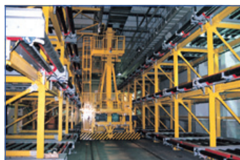
航空貨物コンテナ荷捌き設備