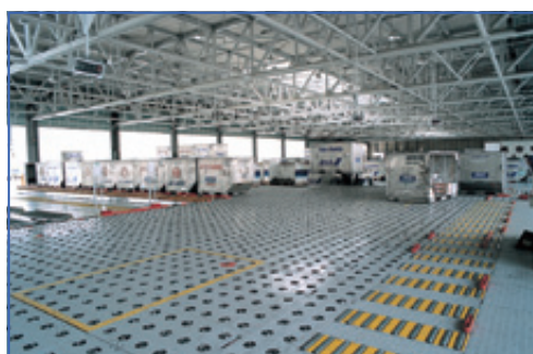
航空貨物コンテナ保管設備