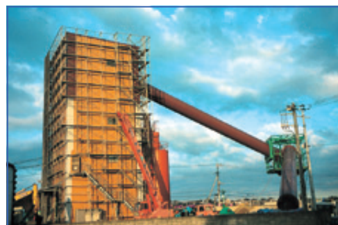
生コンプラント設備