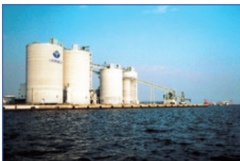
セメントサービスステーション設備