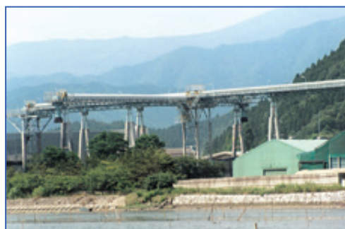
石炭搬送コンベヤ設備